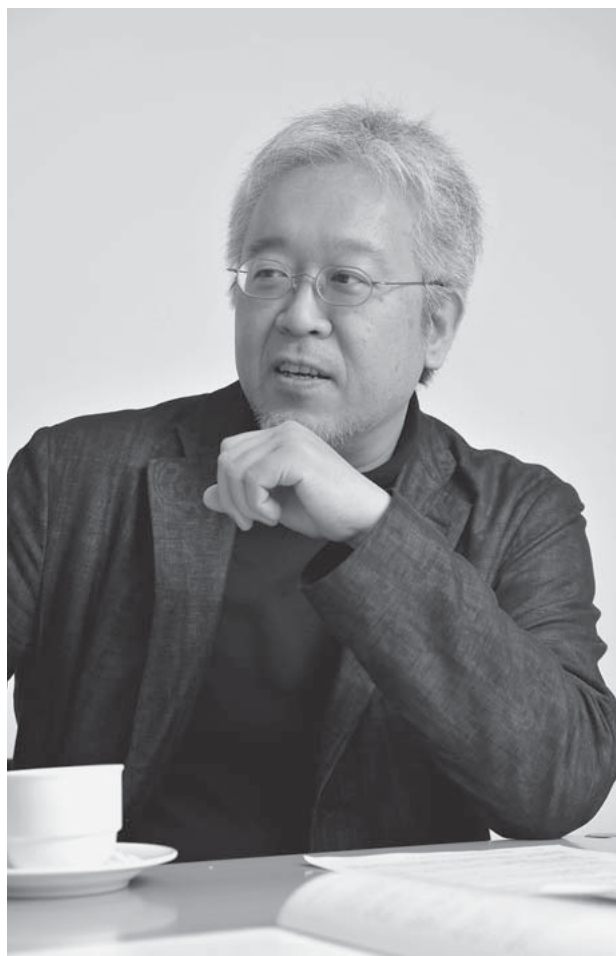
原 研哉（はら けんや）

原 日本に限ったことではないでしょうね。ただ、僕はそういうデザインと経済の関係を否定しているわけではないん