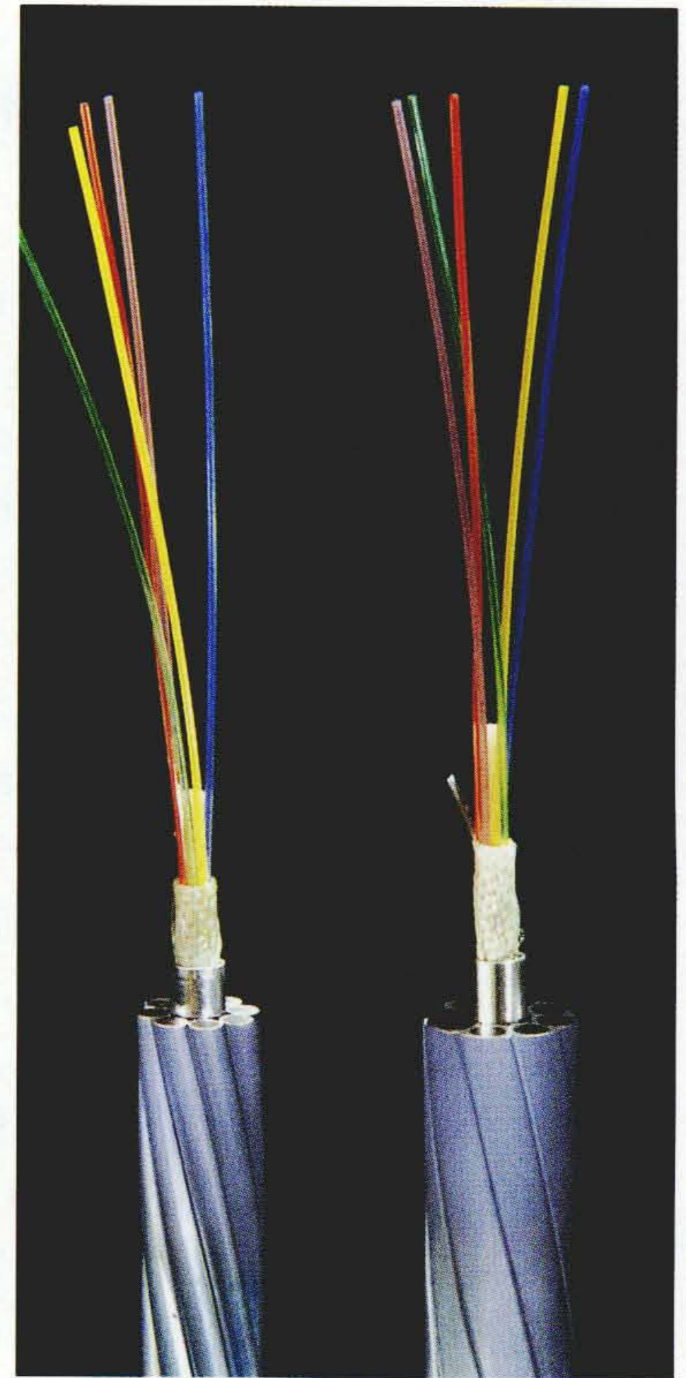
1.5 \mu m帯SM光ファイバ 大容量・長距離通信線路として光ファイバ複合架空地線(OPGW)への適用が期待されている。

\mu m帯のシステムに比較し、2倍以上の中継距離を実現することが可能であるため、いっそうの大容量化及び長距離化を担う伝送路として、実用化への期待が大きい。