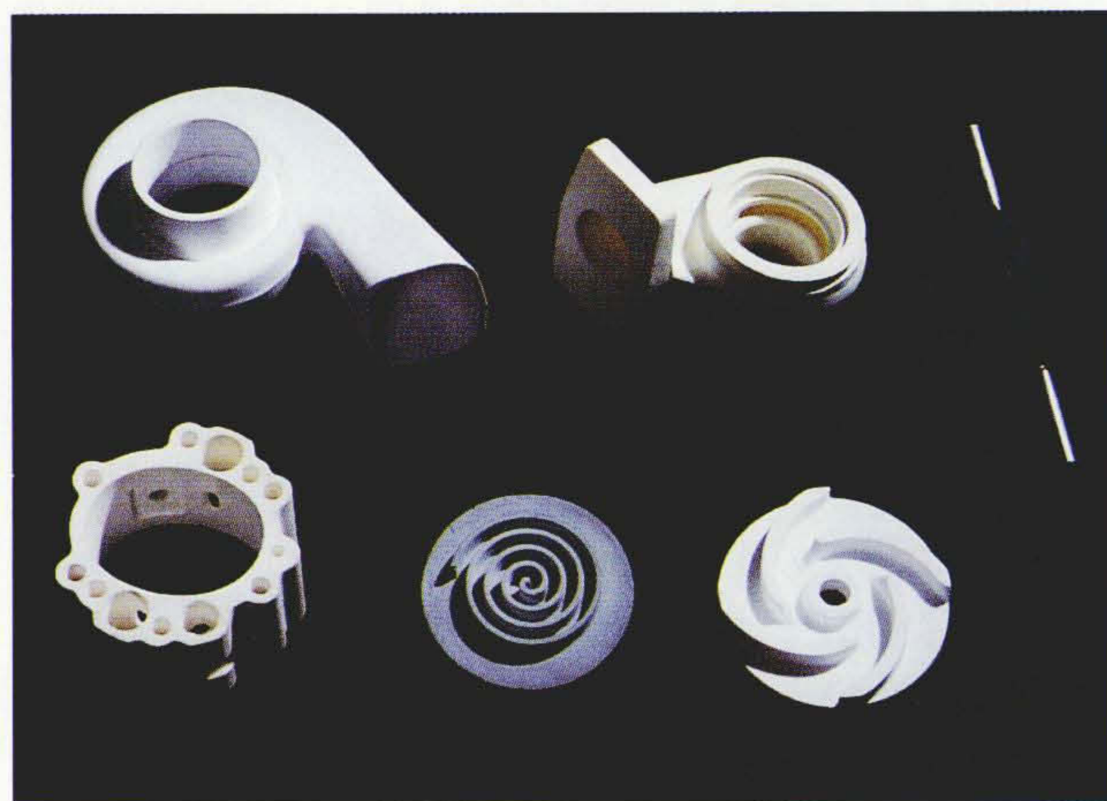
自己崩壊性鋳型を使って成形したセラミックス機械部品

る鋳型(熱崩壊性鋳型)を用いることであり、成形時の収縮割れの防止や鋳型の除去が極めて容易となるため、中子を必要とする複雑形状品や、鋳型の分割が難しい形状の部品を一体で成形することができる。