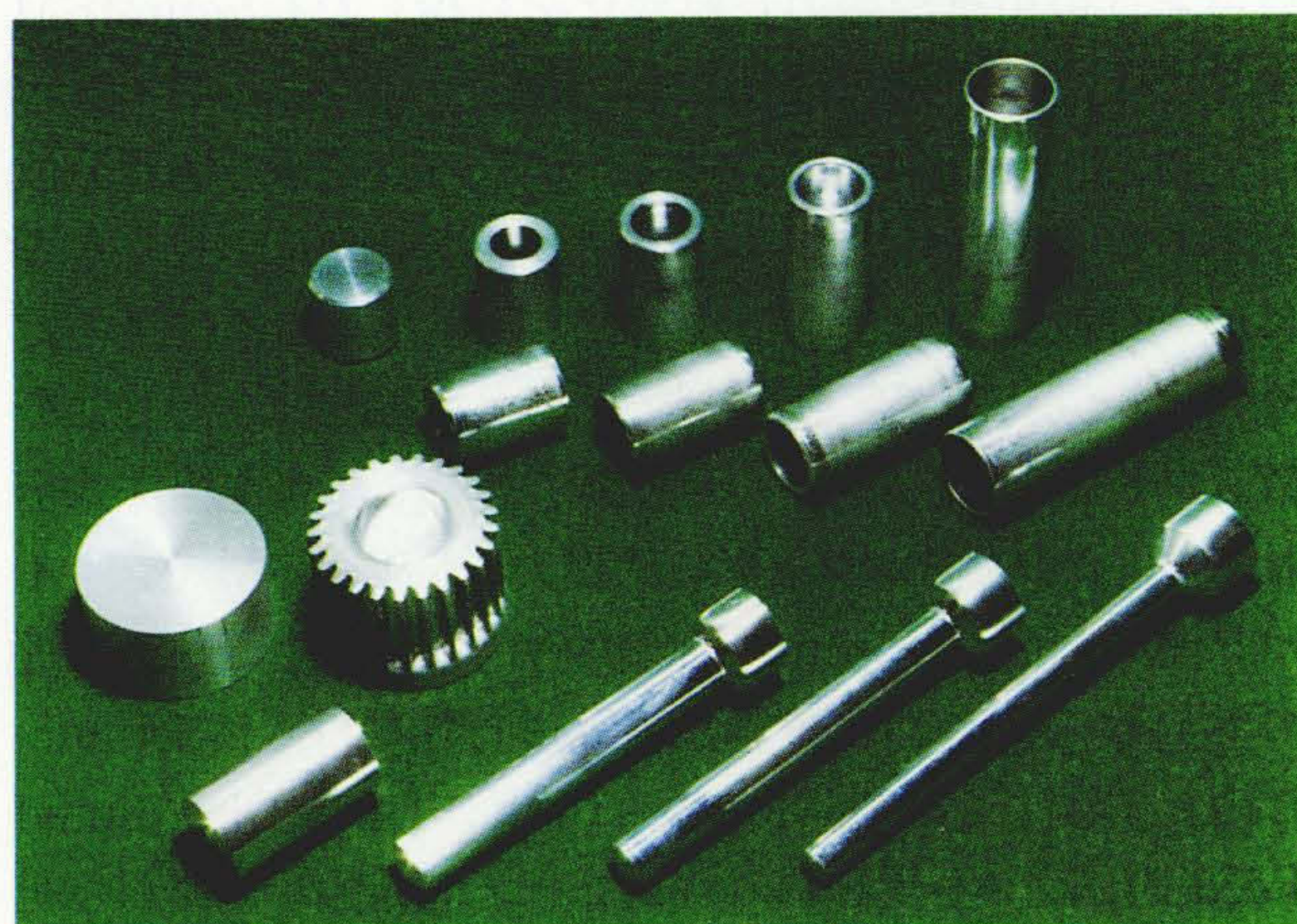
各種アルミニウム材の加工例

滑前処理が不要となり加工工程が大幅に簡略化されるため、生産コスト低減が期待できる。現在、VTRシリンダの生産に全面的に採用されており、更に広くアルミニウム材の部品加工への展開が期待できる。