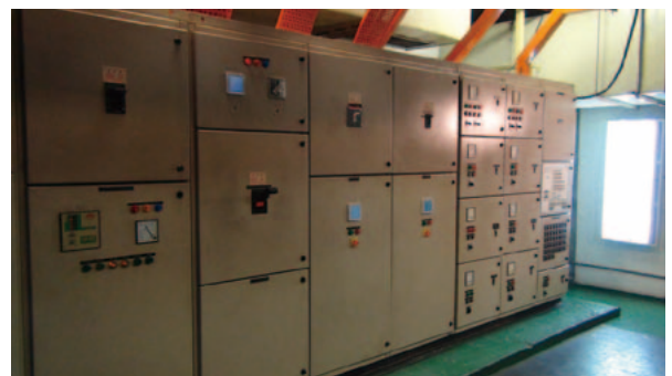
2 Sunway PFM Sdn. Bhd.本社ビルの空調関連設備

Sunway Group は今後、大学、ショッピングモール、病院、ホテルなどの保有施設に統合的エネルギーマネジメントシステムを導入する予定であり、日立はその一日も早い実現をサポートしていく。