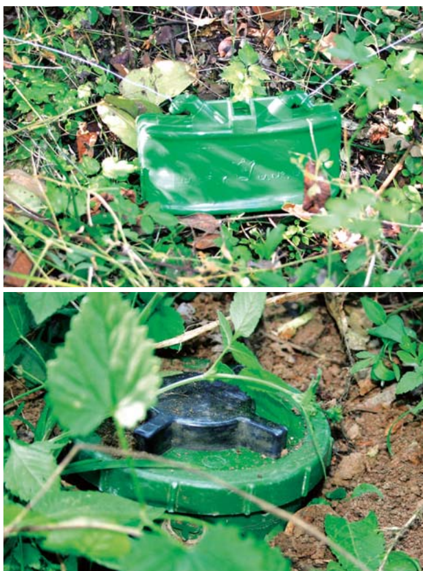
図1 代表的な対人地雷

M18A-1クレイモア(米国製)は、750個の鋼球が収納されており、1 kmで飛散する、最大級の指向性地雷である。