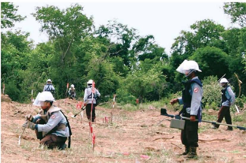
図3 カンボジアでの地雷除去状況

生い茂った灌(かん)木を伐採処理する16 t級の対人地雷除去機(上)と、伐採後に探査機で探査し、人によって掘り起こして撤去する様子(下)を示す。