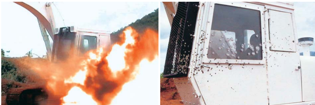
図2 カンボジアでの対人地雷爆破試験(1999年)

当時、日本国内の地雷はすべて破棄すること(オタワ条約)を決めており、当然、国内で対爆試験はできなかった。したがって、導入を期待していたCMACに協力を依頼し、爆破試験を実施した(図2参照)。