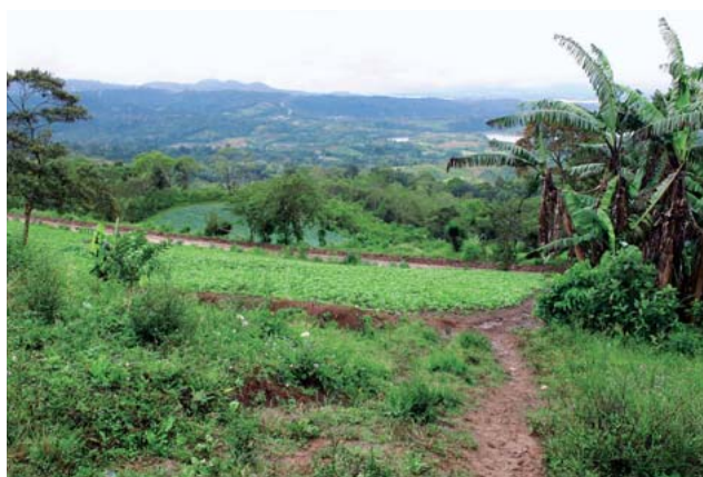
図4 ニカラグアでの稼働（左）と復興後の状況（右）

ニカラグアでは斜面でプッシュを処理しながら地雷を撤去した。復興後は野菜・コーヒー豆などが育てられている。