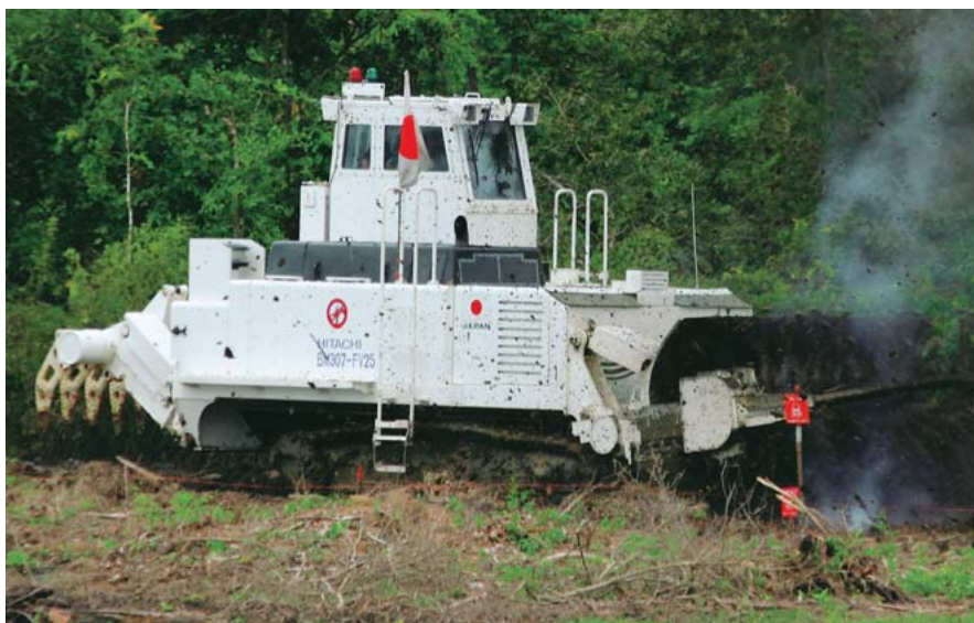
図8 FV25フレールハンマー式地雷除去機

油圧ショベルの先端にフレールハンマーを装備して、大型地雷での試験でも耐久性が確認された大型地雷除去機の外観を示す。