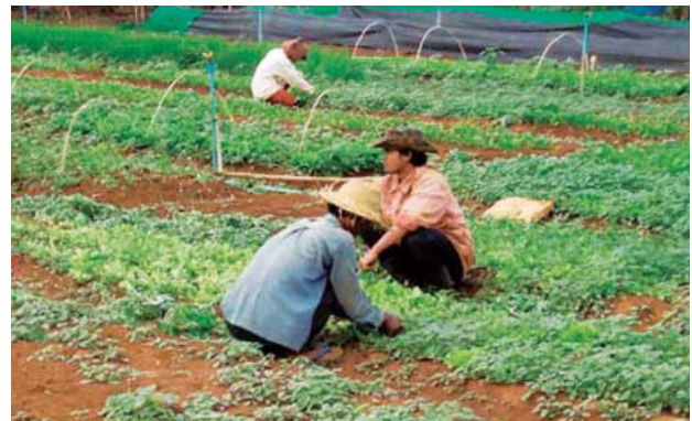
図9 復興された地雷原

カンボジアでは、今年3月に5年ぶりに訪れたプレアブフア州の地雷除去後の土地に学校が建ち、農地や農業研