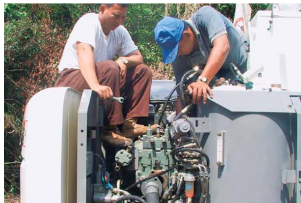
図5 現地納入指導（上）と修理状況（下）

運転指導やメンテナンス指導のほかに、納入時の作業手順についても教育を行っている。また、現地修理は、できるだけ現地のメカニックに体験させながら実施している。