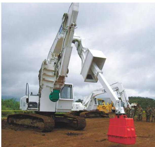
図6 探知器の基本メカニズム(上)と探知器付き除去機(下)

サーチコイルにパルス状の電流を流して磁界を発生させ、近傍の金属物に渦電流を流し、渦電流による二次磁界を検出して金属物を探査する。